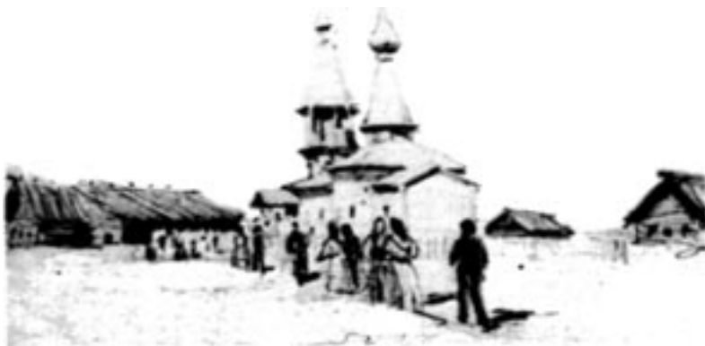
Вокнаволоок.