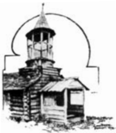
Церковь в Бабьей Губе. С рис. Луиса Снарре, 1892 г.

политика ортодоксального Рима, равно как и реформированной лютеранской церкви, отличалась нетерпимостью и стремлением к подавлению и искоренению инакомыслия. Впрочем, справедливости ради следует отметить, что мир православия тоже не отличался веротерпимостью. Не только браки русских царственных особ нередко не могли состояться из-за разной конфессиональной принадлежности жениха и невесты, крестьянский “мир” - община в православном карельском приграничье XVII-XVIII столетия принимала на жительство “чужаков” - “выходцев из-за шведского рубе-